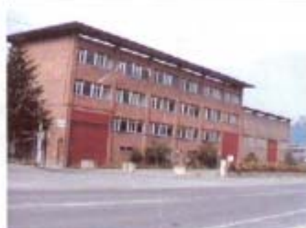
Pabelloi berriaren bulegoetako aldea

Durante el mes de mayo, se han firmado las escrituras de compraventa de lo que va a ser un nuevo taller y la sede de las oficinas centrales de LANTEGI BATUAK.