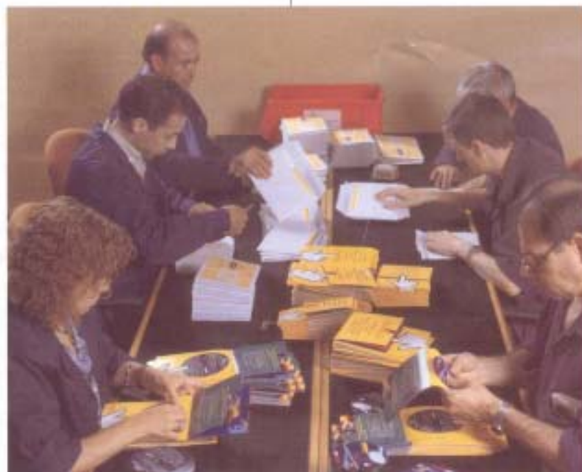
Lehenengo ekintzak, Guposten, Derion eta Aixerrotan izango dira

ERGOHOBE programa, lanpostuen hobekuntzarako da