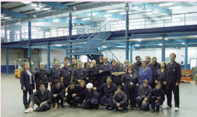
Foto del primer grupo de trabajadores/as de Amorebieta