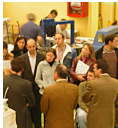
Tras la jornada, se realizó una visita al taller de Publicidad Directa