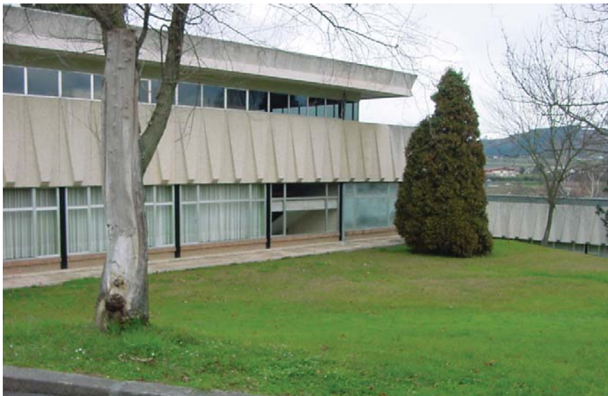
Situación actual del centro OLA