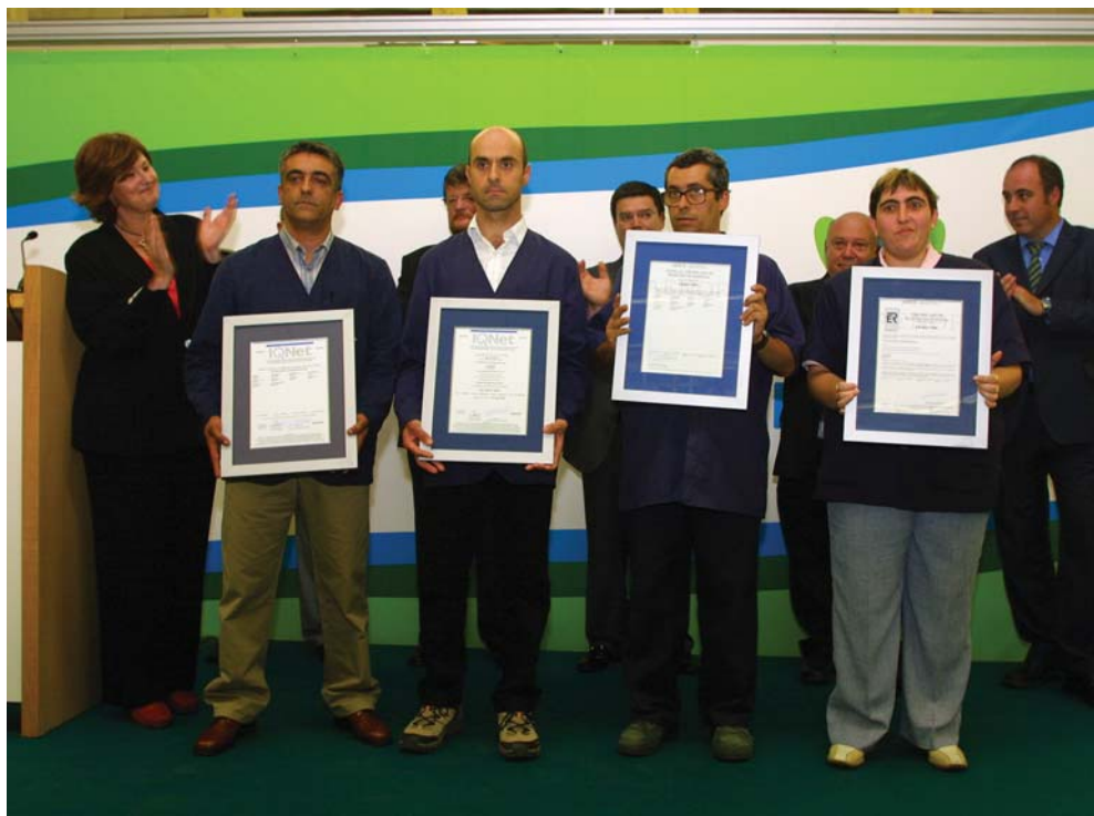
El momento de recogida de la certificación AENOR, por parte de cuatro personas del taller