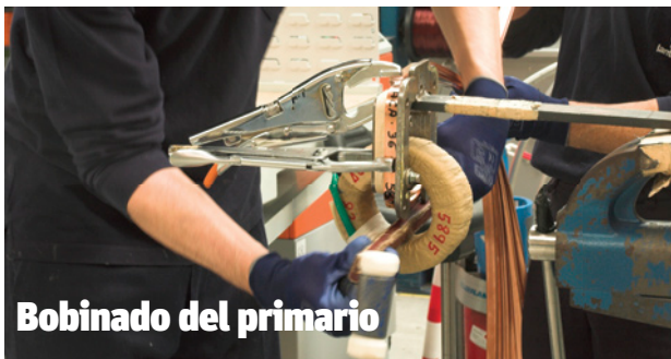
Bobinado del primario

Empaquetado y colocación de bornas: se unen los diferentes secundarios bobinados en los pasos anteriores, formando un paquete. Si se está montando un aparato de media o baja tensión, se colocan las bornas.