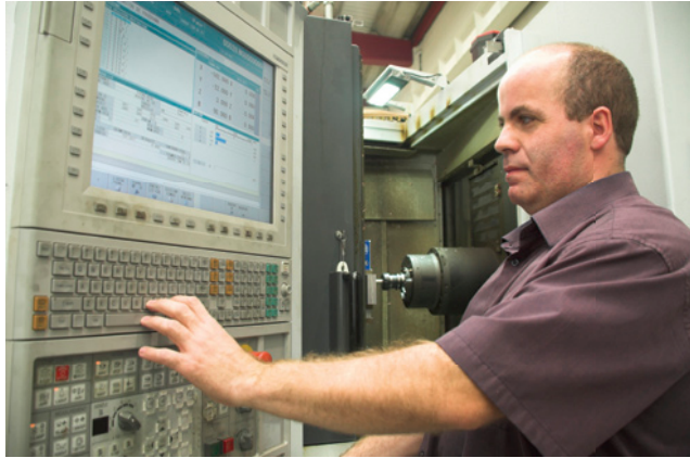
► Lantegi Batuak se ha estudiado en la facultad de Sarriko, como modelo de gestión en la línea de la economía social y el bien común

Lantegi Batuak se ha estudiado como un modelo de gestión en la facultad de Administración y Dirección de Empresas de Sarriko, dentro de la asignatura de Introducción a la Economía.