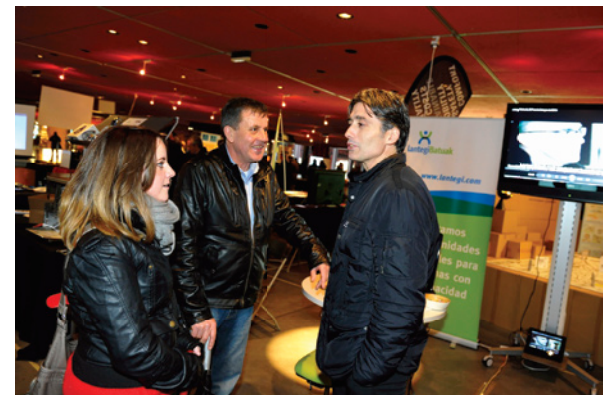
► Quienes se acercaron a nuestro stand conocieron nuestras capacidades para colaborar y enriquecer sus proyectos con nuestra experiencia, conocimientos técnicos, nuestras instalaciones y nuestro conocimiento en discapacidad

Gainera, Lantegi Batuak-eko lankidetzako esperientziak partekatu genituen bezero eta erakunde aliatuekin, besteak beste, ZIV, Legrand, Electric City Motor, Euraslog, Moway eta HIB. Bi aldeei etorkizunerako prestatzea eta lehiakortasuna mantentzea ahalbidetuko diguten akordioak egin ditugu haiek.