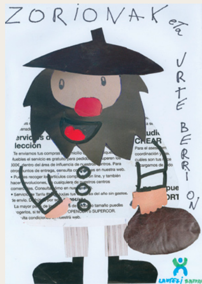
► La postal del equipo de limpieza de Lobiano (Ermua) recibió una mención especial