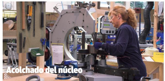
Acolchado del núcleo

Laboratorio: se comprueba que el secundario tiene las espiras y los valores que se requieren.