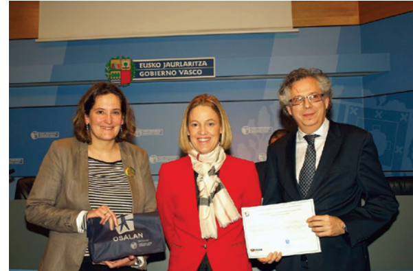
Osalanek saritu zuen proiektua.

Proiektu hau aurrera eramateko Puntodis, Lectura Fácil Euskadi eta Arymuxen lankidetzaz izan dugu, eta Osalanek eta Europako Gizarte Funtzak %100ean finantzatu dute.