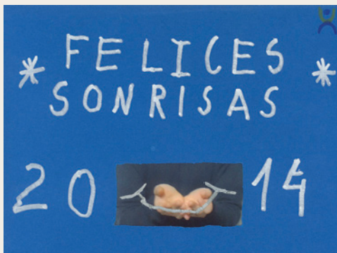
► La postal ganadora, de Roberto Quintana, se abría y guardaba una sorpresa en su interior.