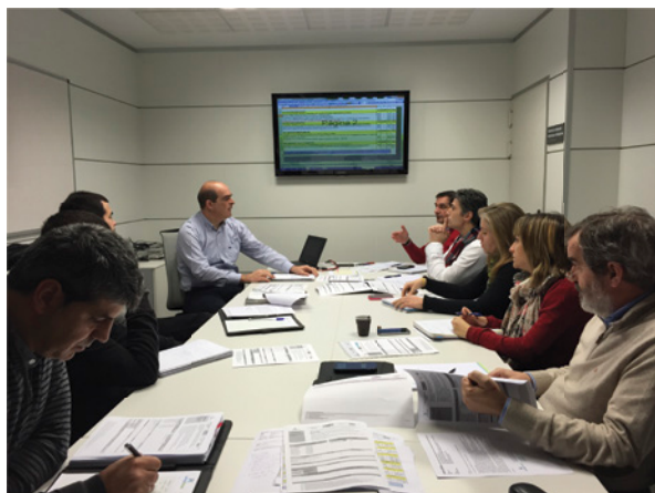
► En la imagen, el equipo de Industrial en una de sus reuniones

2015eko lehen hilabete hauetan, lanean hasi dira 2015-2017 estrategian definitutako talde egonkorak: Kudeaketa, Marketina, Pertsonak, Industria, Zerbitzuak, industria eta zerbitzuetako lan-taldeak eta Facility Services. Horiek guztiak dagoeneko finkatu dituzte euren misio eta helburuak, lan-bilera bat burutu dute gutxienez eta, egun,