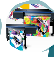
Soluciones gráficas digitales