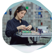
Montajes electromecánicos y manipulados